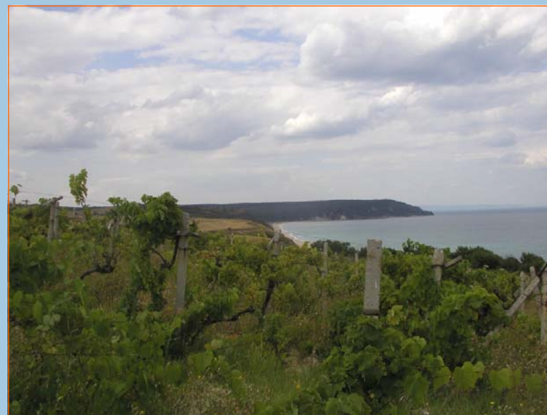
Някои от знаковите заменки край морето бяха извършени в района на един от последните диви плажове Кара дере.

Предлагат на премиера решение на проблема със заменените гори: http://forthenature.org/news/1335 .